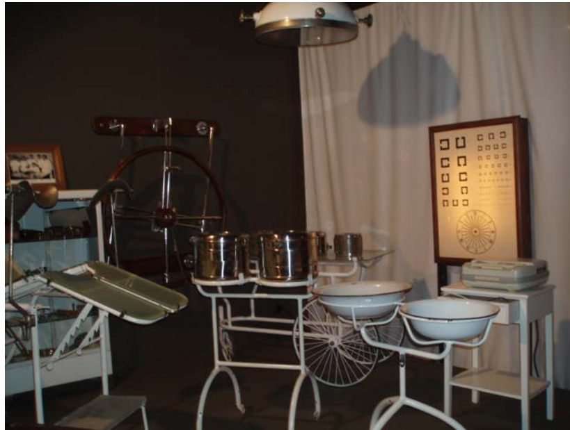
Imagen 4. Espacio dedicado a la enfermería.