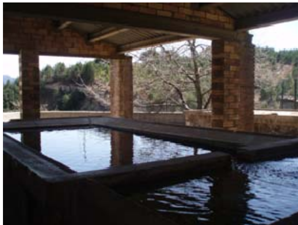
Imagen 6. Lavadero de la colonia