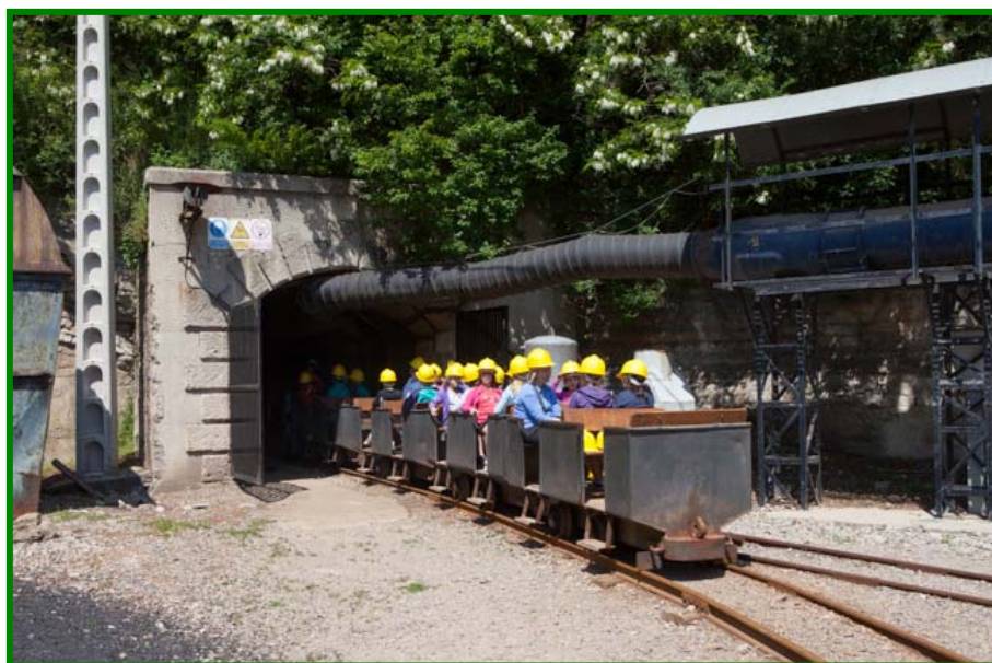
Imagen 1. Escolares en pleno viaje al interior de la mina.

El Museo se localiza en la Colonia Minera de Sant Corneli, en Cercs, Comarca del Berguedà (Barcelona), originada a finales del siglo XIX como respuesta del emplazamiento de la industria del carbón en la zona. La propuesta de creación del Museo como activo económico toma fuerza en los últimos años del fin del pasado milenio; se entendía que permitiría activar el desarrollo de la zona frente al declive económico ocasionado por el cierre de la minería. Así, cobró fuerza la necesidad de valorización del patrimonio histórico-social debido a la industrialización para convertirlo en una oportunidad para salir de la crisis.