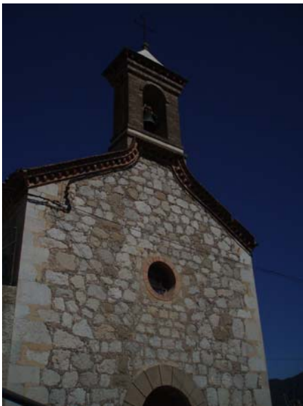
Imagen 6. Iglesia de Sant Corneli