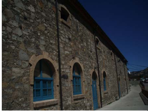
Imagen 5. Edificación de la colonia

La Colonia , situada en un lugar central de la cuenca minera, al pie de la mina y envuelta de un paisaje natural excelente, permite poner en valor el paisaje de montaña y la historia social (con un activo de personas que aún están vinculadas al mundo minero). Se produce el encuentro entre el hoy del visitante y el pasado de las gentes de la mina. En Sant Corneli (la Colonia) viven familias que participan de las actividades muy relacionadas con el universo del ocio (equipamientos turísticos) que se organizan en torno al museo. En la visita a la colonia se destacan los hitos de la misma: la iglesia y el teatro que mantienen ambos su imagen y función de antaño; el lavadero, ahora espacio simbólico por su valor como espacio social de las mujeres; el Hogar Minero , al que se le ha dado un nuevo uso (reformado para albergar la parte administrativa del museo y secciones de documentación y conservación, sala de actos...). La memoria histórica que encierran la colonia y el museo es excepcional, siendo un conjunto patrimonial que con su puesta en valor consigue el propósito del desarrollo de la zona.